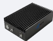
Available 220V System Benchtop Amplifier