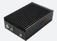
Available 220V System Benchtop Amplifier